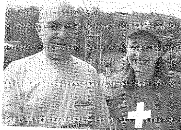
Daniel Jositsch mit Barbara Schmid-Federer.